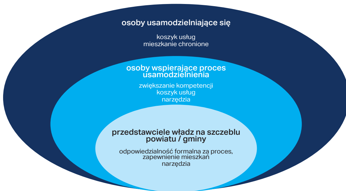
Rys. 3. Grupy odbiorców modelu Opracowanie własne.

Proces usamodzielniania, który jest przedmiotem niniejszego modelu ma na celu doprowadzić osobę usamodzielnianą do podjęcia samodzielnego życia.