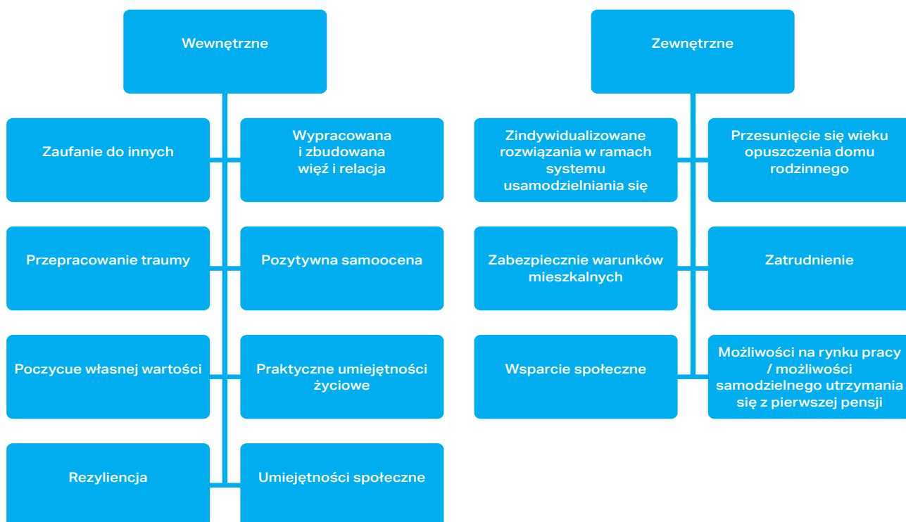
Rys. 1. Warunki niezbędne do pomyślnego usamodzielniania z pieczy zastępczej

Młode osoby przebywające w pieczy usamodzielniają się więc ok. 6-7 lat wcześniej niż ich rówieśnicy, którzy wychowywali się stale w rodzinach pochodzenia. Okres przygotowania do usamodzielniania, w którym można liczyć na wsparcie, w tym finansowe i lokalowe, nabyć umiejętności życiowe i te potrzebne na rynku pracy, zgromadzić zasoby finansowe jest drastycznie krótszy dla opuszczających pieczę, w porównaniu do ich rówieśników wychowujących się w rodzinie biologicznej.