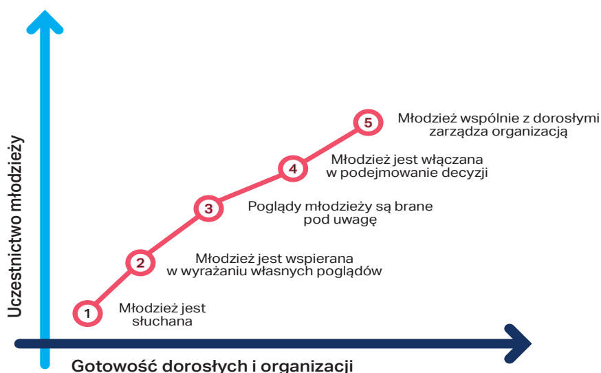
Rys. Ścieżka uczestnictwa młodzieży. Opracowanie własne na podstawie Harry'ego Shiera.

Rozpatrując temat usamodzielniania się młodych osób z pieczy zastępczej nie można analizować go bez obecnego kontekstu społecznego, ekonomicznego i kulturowego. Okres życia młodych ludzi, który przypada na ich usamodzielnianie się to okres od 18 do ok. 21 roku życia. Z punktu widzenia psychologicznego, biologicznego i rozwojowego, jest to wiek dużych zmian w psychice, fizyczności, zdolnościach poznawczych młodych ludzi. Pierwsze zmiany zaczynają się w czasie adolescencji, kiedy młodzi ludzie dojrzewają do zdolności decydowania o sobie, odkrywają sens własnego istnienia i kiedy kształtuje się własna tożsamość, wizerunek własnej osoby. Zmiany te kontynuowane są w czasie wczesnej dorosłości. To też czas, kiedy proces partycypacji jest bardzo potrzebny i wskazany, a jednocześnie bardzo trudny, młodzież testuje granice innych osób, sprawdza też swoje możliwości fizyczne i psychiczne, przechodzi okres buntu wobec swoich autorytetów.